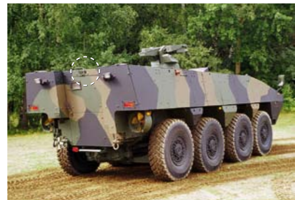
Alle Orlaco zichtsysteem voldoen aan de zwaarste off-road eisen.

Orlaco zichtsysteem zijn zeer geschikt voor professioneel gebruik op off-roadvoertuigen. De camera-monitorsystemen zijn schok- en vibratiebestendig en geven zelfs onder de meest extreme omstandigheden scherp beeld. Ook in het donker functioneert het systeem optimaal, 's nachts ziet de camera meer dan het menselijk oog. Hoogwaardige materialen en kwaliteitscontroles staan garant voor goede prestaties en een lange levensduur.