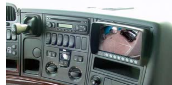
De monitor staat in de lijn van de spiegels.

De landelijke overheid en Europese Unie willen het probleem van de blinde hoek oplossen met spiegels. Er is een Europese richtlijn gekomen om u te dwingen tot maatregelen. Dat betekent concreet dat men u stimuleert om vier spiegels te monteren. De montage van meerdere spiegels leidt niet tot volledig zicht en de kans op ongelukken is nog steeds (te) groot. Bovendien moet de chauffeur dan naar teveel spiegels tegelijk kijken en wordt zijn blikveld verkleind. De echte oplossing is de montage van een frontzichtsysteem van Orlaco. Op de volgende pagina leest u meer hierover.