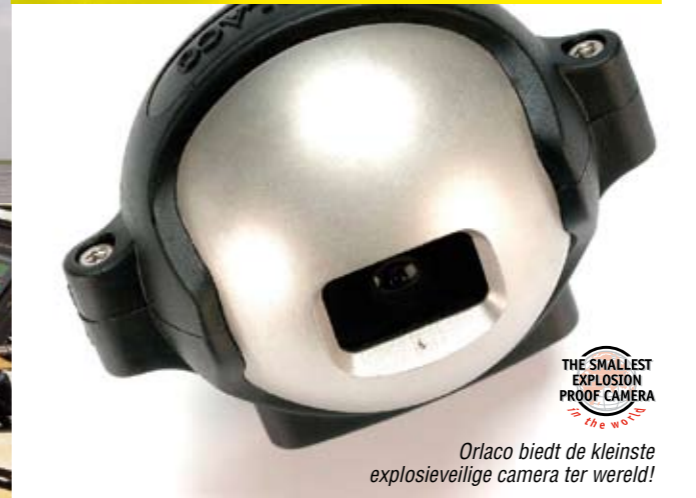
Orlaco biedt de kleinste explosieveilige camera ter wereld!

In explosiegevaarlijke situaties wil men het liefst zo min mogelijk mensen in de buurt hebben. Het is echter noodzakelijk dat er wel zicht is op deze zogenaamde EEX-zones.